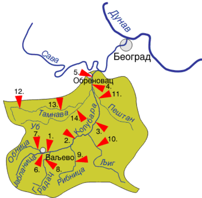
Мрежа станица површинских вода – Слив реке Колубаре

Укупни капацитет три већа водотока (Рибница, Лепеница и Топлица) је мали ( Q=3,3 \text{ m}^3/\text{s} ). Са друге стране због саме природе рељефа ова три водотока се не могу објединити у једну акумулацију па је хидроенергетски потенцијал вода занемарљив. Али се зато ове воде могу користити за водоснабдевање насеља и индустрије како Мионице тако и у нижих делова Колубаре. Речне долине Рибнице, Лепенице и Топлице су дубоко усечене у карбонатне стене градећи клисурасти тип долине са малим градијентима тока. Просечни градијент тока реке Рибнице износи 6,32%. Узводно од Кључа, Лепеница и њене притоке формирају свој повремени ток само у периоду интензивних киша. У току летњег периода поменути део тока реке Лепеница пресушује па се зато зове Сушица. Она, као повремени ток, настаје спајањем више потока и то: Младош, Врбак, Шевинац, Пећина и Прерача.