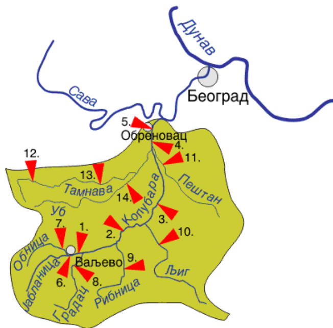
Мрежа станица површинских вода – Слив реке Колубаре

Укупни капацитет три већа водотока (Рибница, Лепеница и Топлица) је мали ( Q=3,3 \text{ m}^3/\text{s} ). Са друге стране због саме природе рељефа ова три водотока се не могу објединити у једну акумулацију па је хидроенергетски потенцијал вода занемарљив. Али се зато ове воде могу користити за водоснабдевање насеља и индустрије како Мионице тако и у нижих делова Колубаре. Речне долине Рибнице, Лепенице и Топлице су дубоко усечене у карбонатне стене градећи клисурасти тип долине са малим градијентима тока. Просечни градијент тока реке Рибнице износи 6,32%. Узводно од Кључа, Лепеница и њене притоке формирају свој повремени ток само у периоду интензивних киша. У току летњег периода поменути део тока реке Лепеница пресушује па се зато зове Сушица. Она, као повремени ток, настаје спајањем више потока и то: Младош, Врбак, Шевинац, Пећина и Прерача.